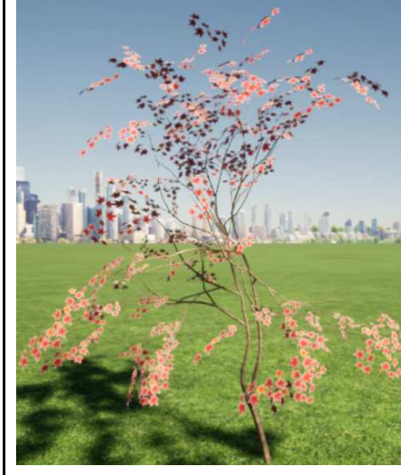
イロハモジ 紅葉株立_3_H3.5