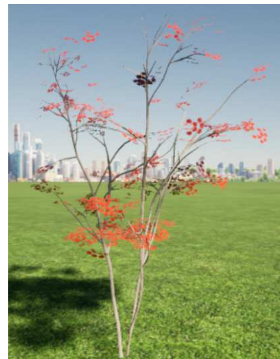
ノムラモジ 紅葉株立_1_H2.5