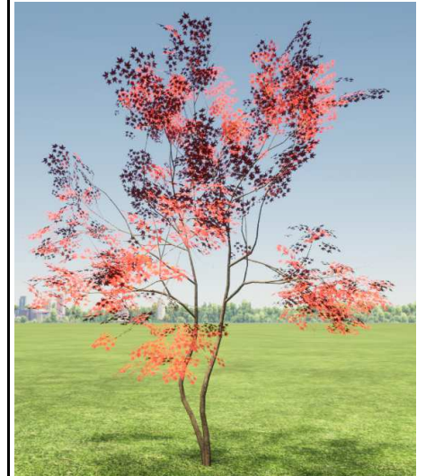
イロハモジ 紅葉株立_4_H3.5