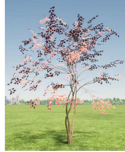
イロハモジ 紅葉株立_2_H3.5